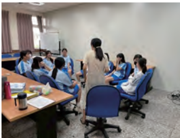
在關係中微加幸福小團體