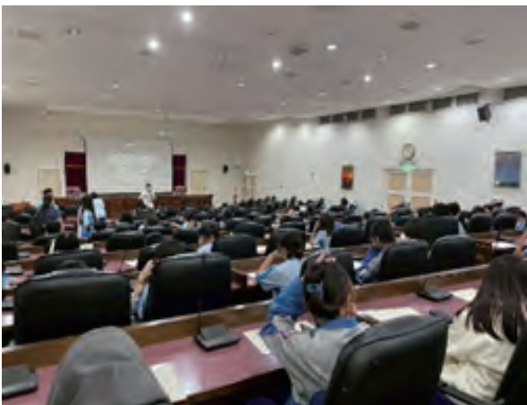
高一生命教育影展