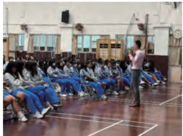
情感暨家庭教育講座