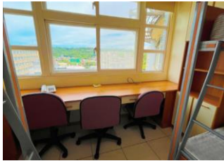
中央空調套房(3人房)