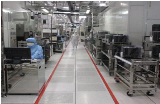
無塵室工作環境剪影