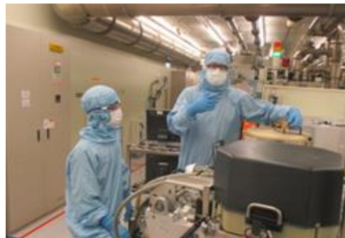
半導體機台操作實務訓練