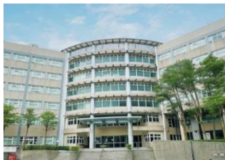
旺宏員工專屬宿舍