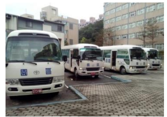
上下班/課免費交通車